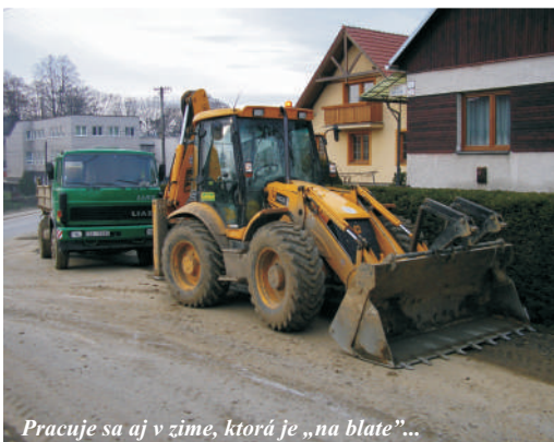
Pracuje sa aj v zime, ktorá je „na blate“...