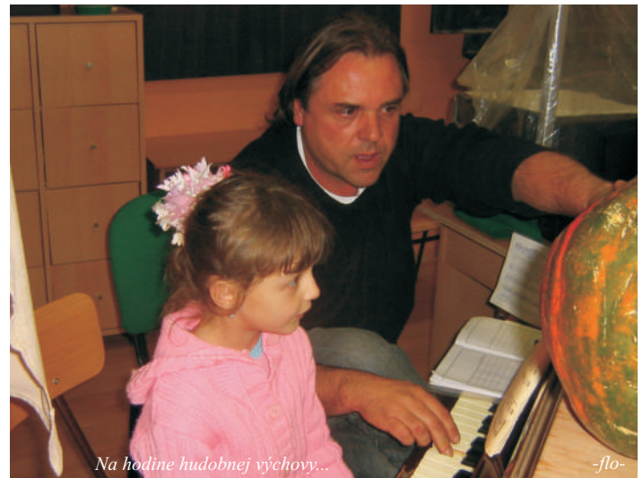
Na hodine hudobnej výchovy...