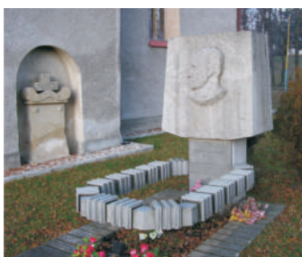
Hrob Jonáša Záborského v Župčanoch.