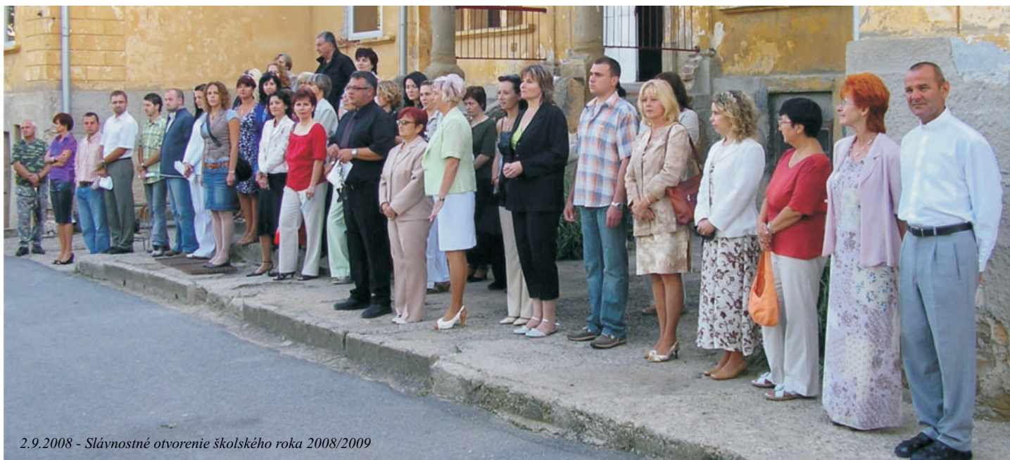
2.9.2008 - Slávnostné otvorenie školského roka 2008/2009