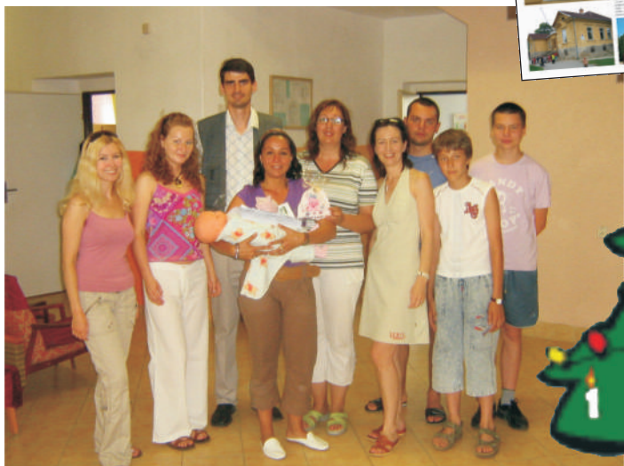
Prvé číslo časopisu pripravili spoločne žiaci a učitelia školy.