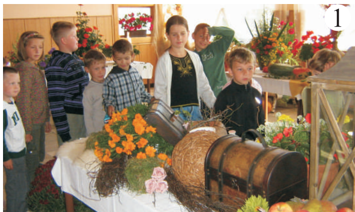
Jesenná výstava 2009 v Sále kultúrneho domu obce Svinia – skutočná „pastva“ pre oči...