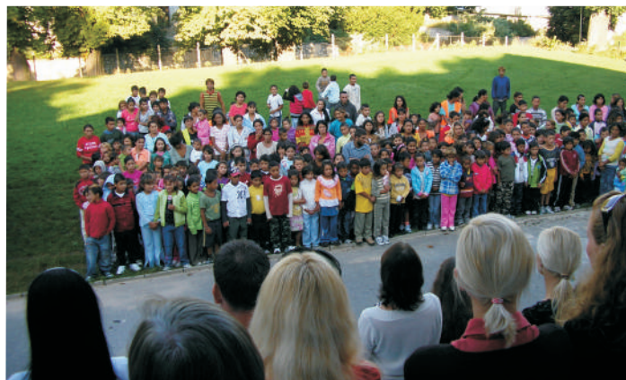
Žiaci zo špeciálnych tried mali zo začiatku roka veľkú radosť.