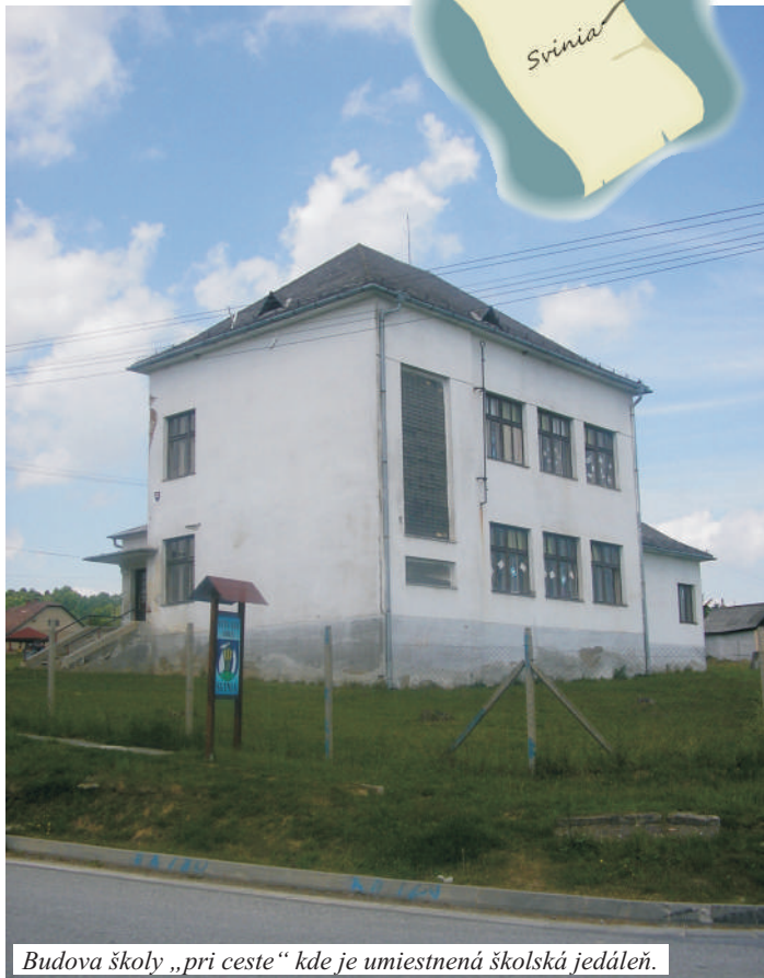
Budova školy „pri ceste“ kde je umiestnená školská jedáleň.

školstva, teda v dnešnom ponímaní ministrom pre školské záležitosti Slovenska, navštívil aj obec Svinia, nakoľko sa tu na jeseň 1946 otvorila vtedy „nová škola“ pri ceste (budova kde je dnes jedáleň). Ako spomienka na túto udalosť sa nám zachoval na poslednej zapísanej strane prvej obecnej kroniky z r. 1933-1942 jeho vlastnou rukou napísané venovanie a podpis. Zrejme kronikár prerušil písanie kroniky (vojnové udalosti) a keďže v r. 1946 ešte neboli zapísané udalosti po roku 1942, dali sa pánovi poverníkovi podpísať na nasledujúcu voľnú stranu, teda stranu 60. Tam sa ukončilo aj písanie tejto kroniky a zaviedla sa nová kronika s prvým záznamom od roku 1949. Laco Novomeský napísal: „Na pamäť otvorenia novej budovy št. ľudovej školy v