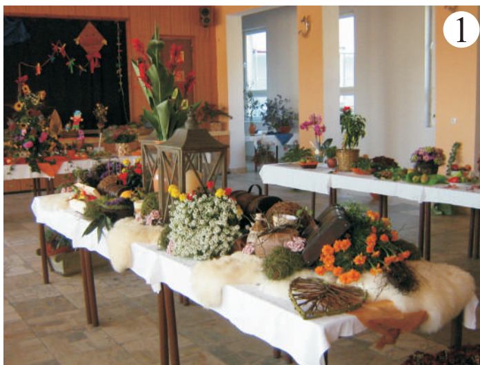
Jesennú výstavu, ako každoročne, pripravilo vedenie školy v spolupráci s obecným úradom – výsledok bol veľmi hodnotný...