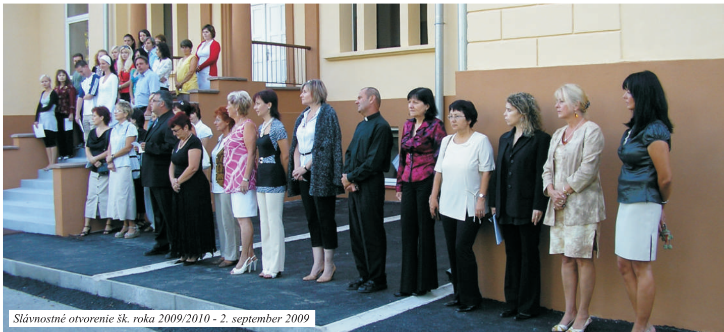
Slávnostné otvorenie šk. roka 2009/2010 - 2. september 2009